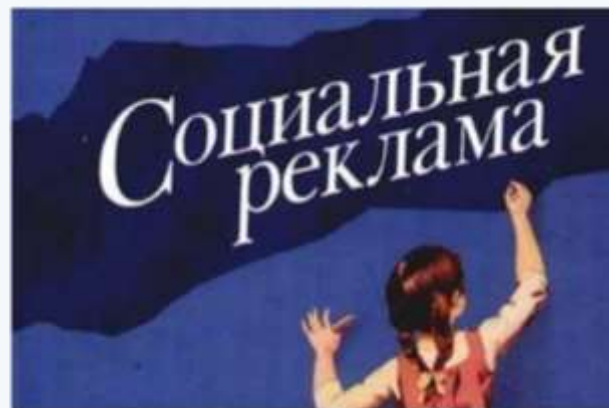
Краевой конкурс социальной рекламы