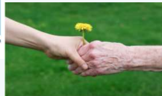
Конкурс авторских программ и проектов специалистов учреждений социального обслуживания населения и социально ориентированных некоммерческих организаций Красноярского края по развитию добровольчества в социальной отрасли «Во благо – 2018»