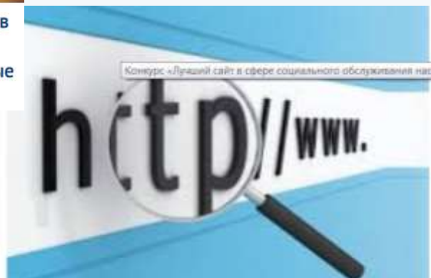
Конкурс «Лучший сайт в сфере социального обслуживания населения Красноярского края»