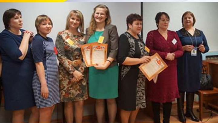
Краевой конкурс методических разработок специалистов учреждений социального обслуживания населения и некоммерческих организаций Красноярского края «Новые горизонты»