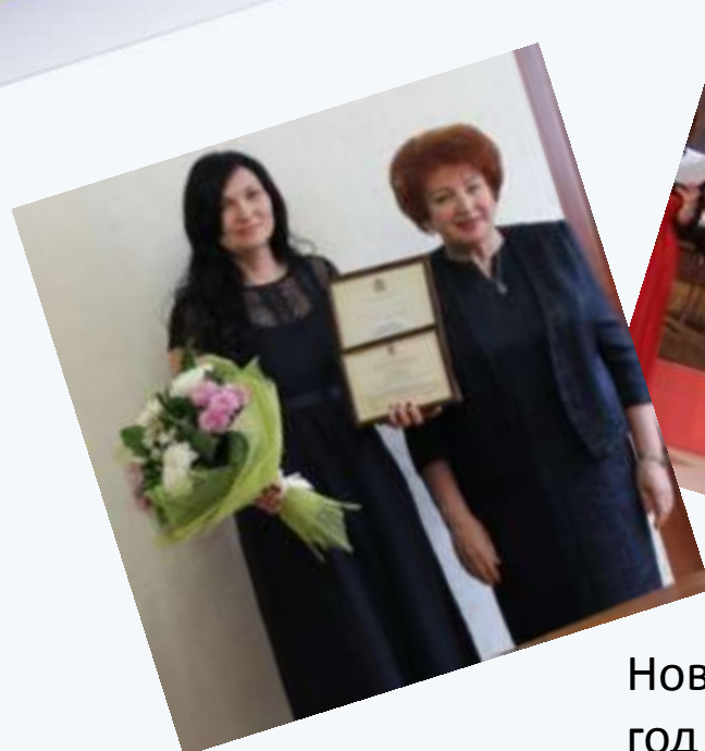
Новые горизонты – 2018 год