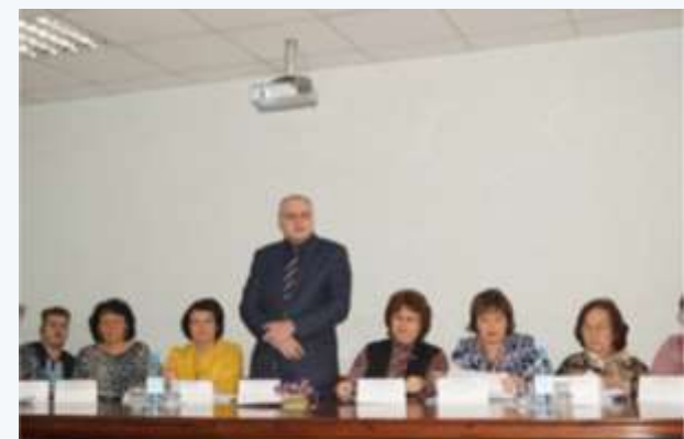
Конкурс на звание «Лучший работник учреждения социального обслуживания» Красноярского края