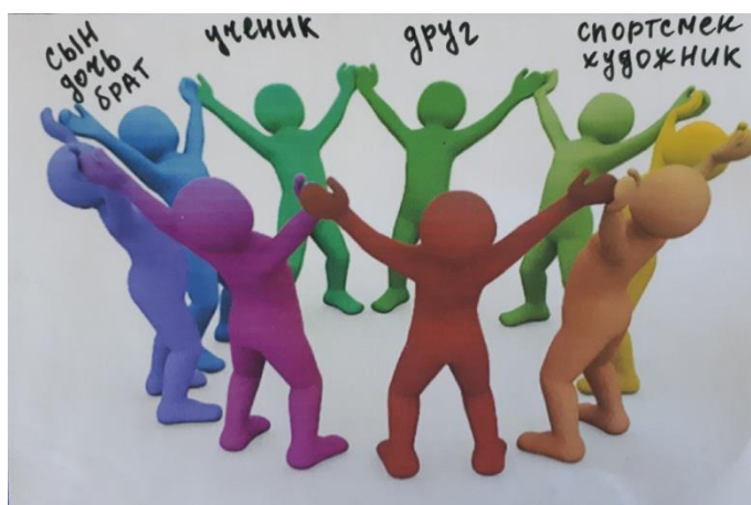
Рис. 4. «Я» - социальное