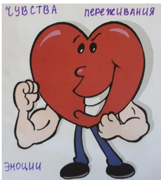
Рис. 3. «Я» - эмоциональное